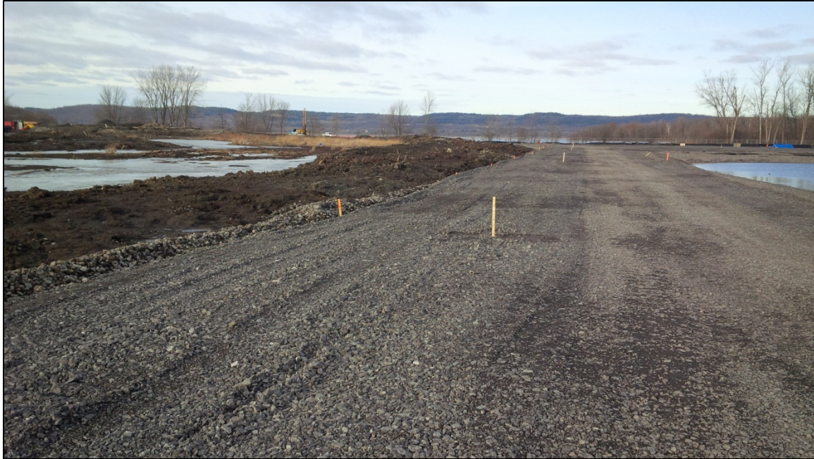
Figure 2 : En regardant dans la direction du nord vers la Rivière des Outaouais et le Québec. De gauche à droite : l'enceinte de confinement des déchets, le nouveau mur périmétrique traversant l'étang de rétention et l'étang contenant les déchets sous la surface devant encore être déplacés.