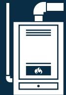
APPAREIL DE CHAUFFAGE